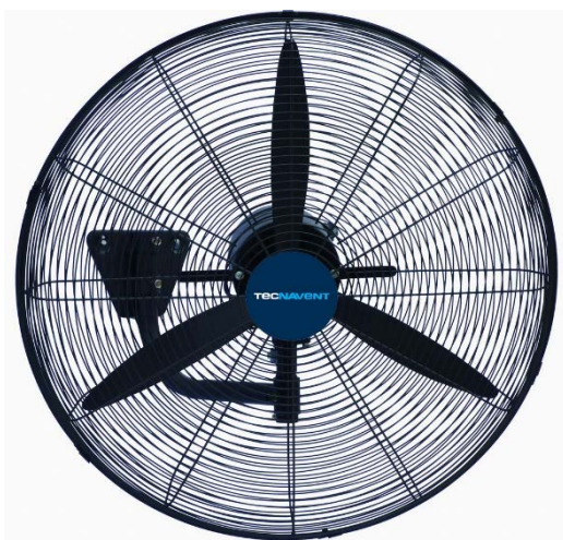
Mod. BDFP 500 / 600-TW